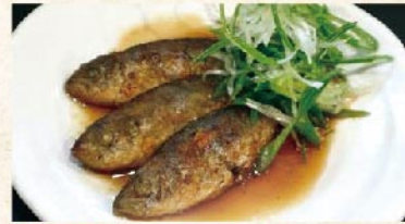
豆アジの南蛮漬け 250円