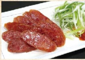
中国ソーセージ 390円