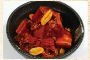
スナック唐辛子 200円