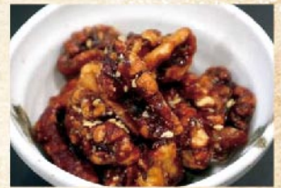
クルミの飴炊き 250円